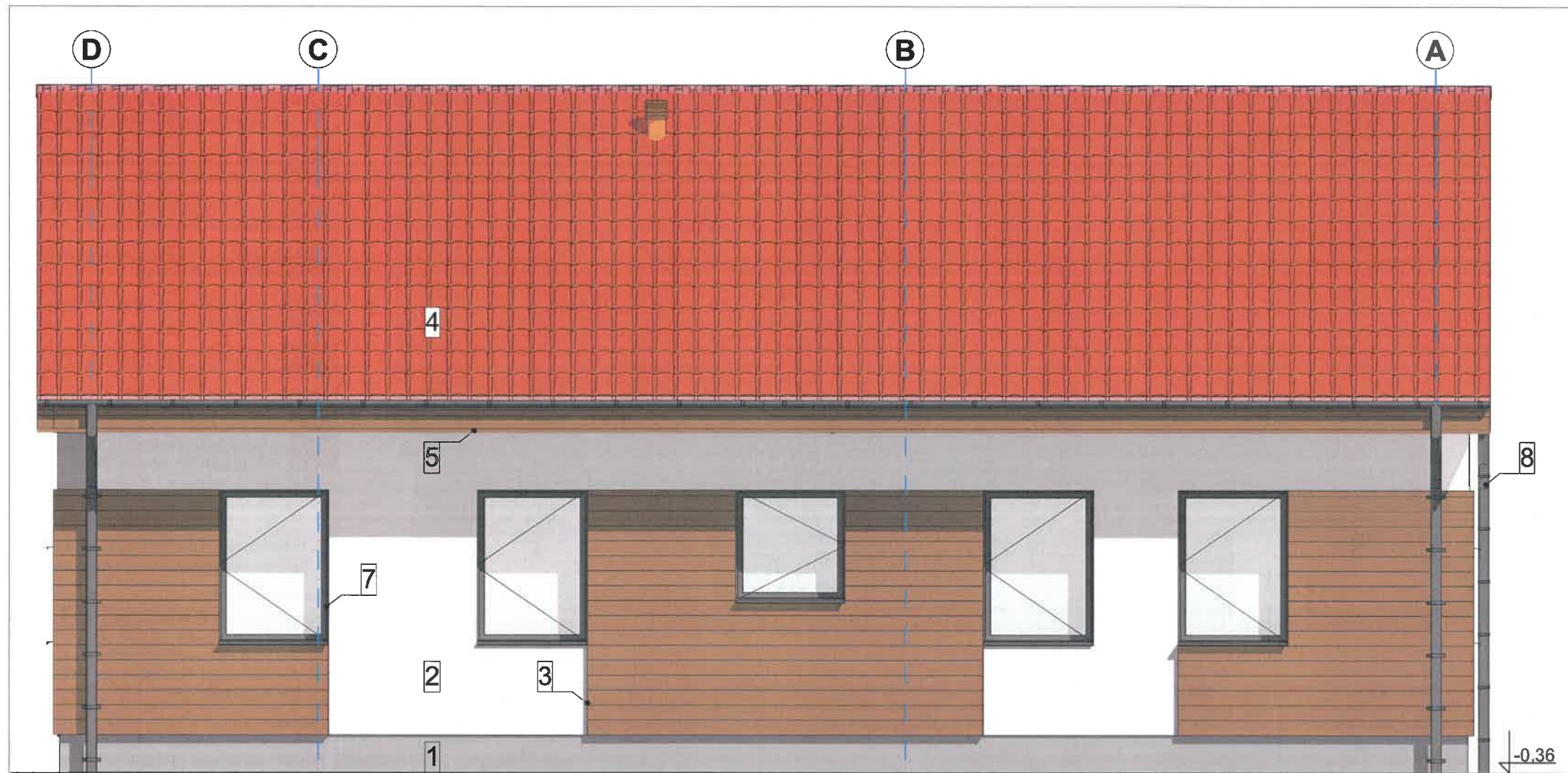
elewacja południowo wschodnia 1:50