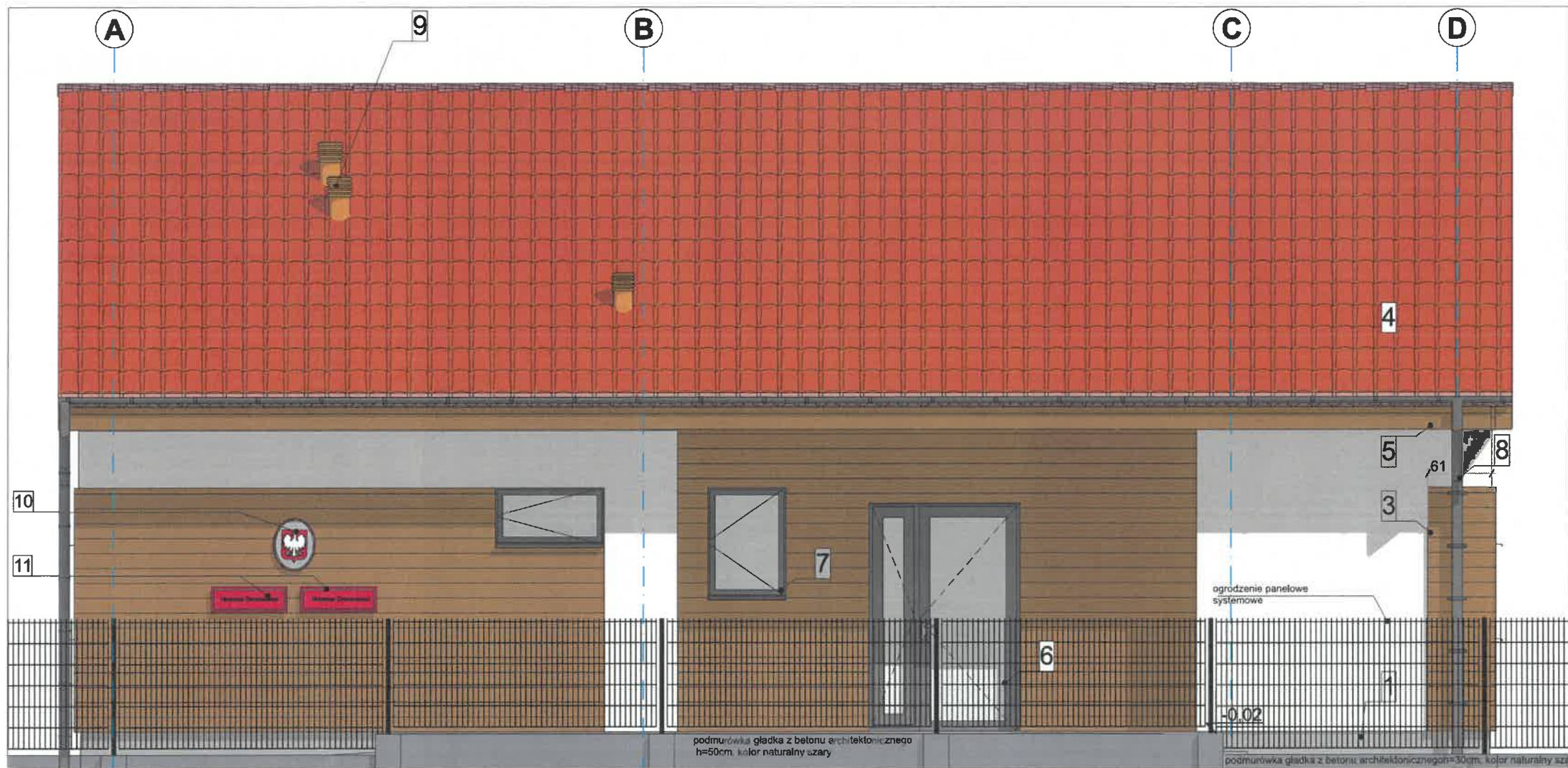
elewacja północno zachodnia 1:50